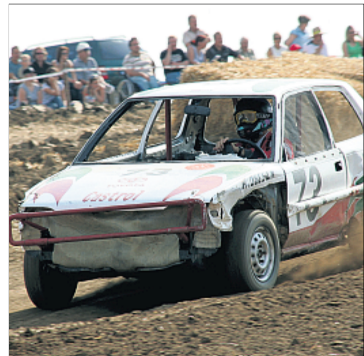
Das aktive Vereinsleben zählt zu den großen Pluspunkten in Sielenbach. Einer der Höhepunkte ist dabei seit vielen Jahren das Autocross-Rennen des Motorclubs.

Garant für das gesunde Vereinsleben ist die konsequente Einbindung junger Erwachsener in Vereinsämter. Man setzt auf die Jugend und überträgt ihr nach und nach mehr Verantwortung. Dadurch wird ein langfristiges Bestehen der einzelnen Vereine gewährleistet.