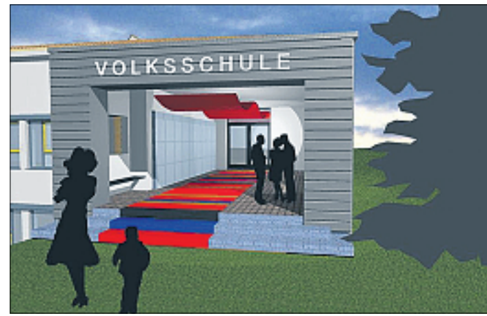
So soll der Eingangsbereich der Volksschule Adelzhausen zukünftig aussehen.

AZ: Was ist mit der energetischen Sanierung der Schule?