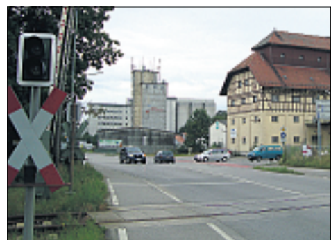
Verkehrsknotenpunkt mit hohem Frustrationsfaktor: Der Bahnübergang in Richtung Oberbernbach sorgt für lange Standzeiten.

Danach wären Staus und Wartezeiten behoben und der Verkehrsfluss deutlich verbessert. Allerdings beeinflusst das nicht das hohe Verkehrsaufkommen durch Oberbernbach – diese „Baustelle“ wird bestehen bleiben.