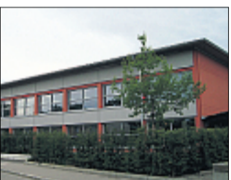
Wird nicht nur positiv bewertet: das Aichacher Hallenbad.

Deutlich fällt bei diesen Bewertungen ins Auge, dass die Antworten nicht unbedingt repräsentativ sind, sondern offenkundig sehr spezielle emotionale Reaktionen widerspiegeln. So werden Umweltqualität und Sauberkeit der Stadt im Allgemeinen gut bewertet – dafür spricht eine Note von 2,4 – rangieren aber mit „schlechter Straßenzustand“ und „Sauberkeit“ bei den Flops dennoch ganz oben. Ein „Exot“ bei den Antworten ist der Lärm durch die Aktienkunstmühle, der außer in der „Tops & Flops“-Rubrik nicht auftaucht. Etwas überraschend sind auch die vereinzelt schlechten Bewertungen des Hallenbades.