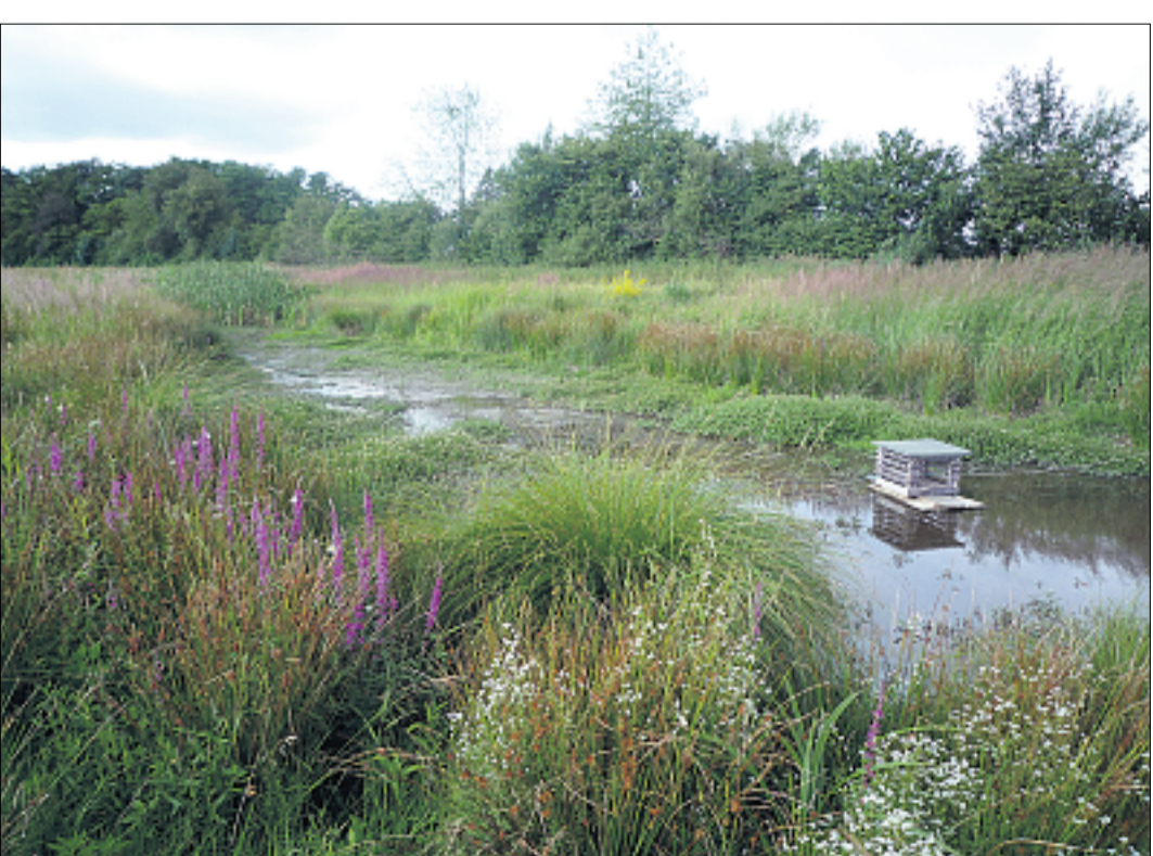
Das wunderschöne Naherholungsgebiet Rossmoos, 10 000 Jahre alt und 150 Hektar groß, lädt zu interessanten Spaziergängen ein.

Die 10 000 Jahre alte Landschaft des Rossmooses