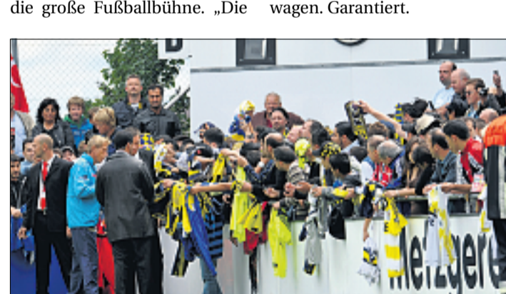
Der TSV Aindling ist das sportliche Aushängeschild nicht nur der Marktgemeinde. Jüngst war Christoph Daum mit dem türkischen Spitzenclub Fenerbahce Istanbul zu Gast.